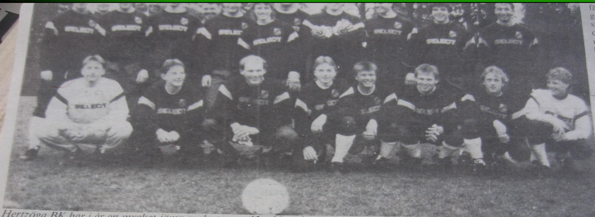
Hertzöga BK har i år en mycket jämn spelartrupp. 15—16 spelare konkurrerar ständigt om platserna i laget.