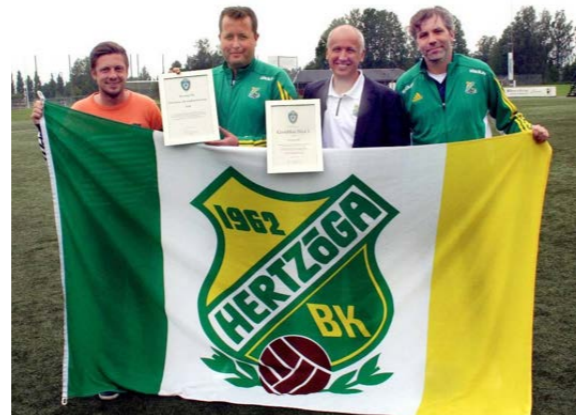
Hertzöga BK har två år i rad utsetts till Årets barn- & ungdomsförening i Värmland, både 2014 och 2015.